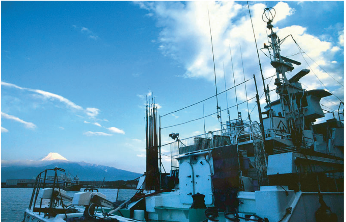
富士山遠望、静岡県沼津市漁港にて

★発行日 平成28年4月23日 ★発行所 大倭出版局 〒631-0042 奈良市大倭町1の12 ☎(0742)44-0015 ★印刷 大倭印刷製 ★定価 1部 250円 年間購読料3,000円(送料共) ★郵便振替 01050-6-67002 大倭出版局 URL http://www.ohyamato.jp