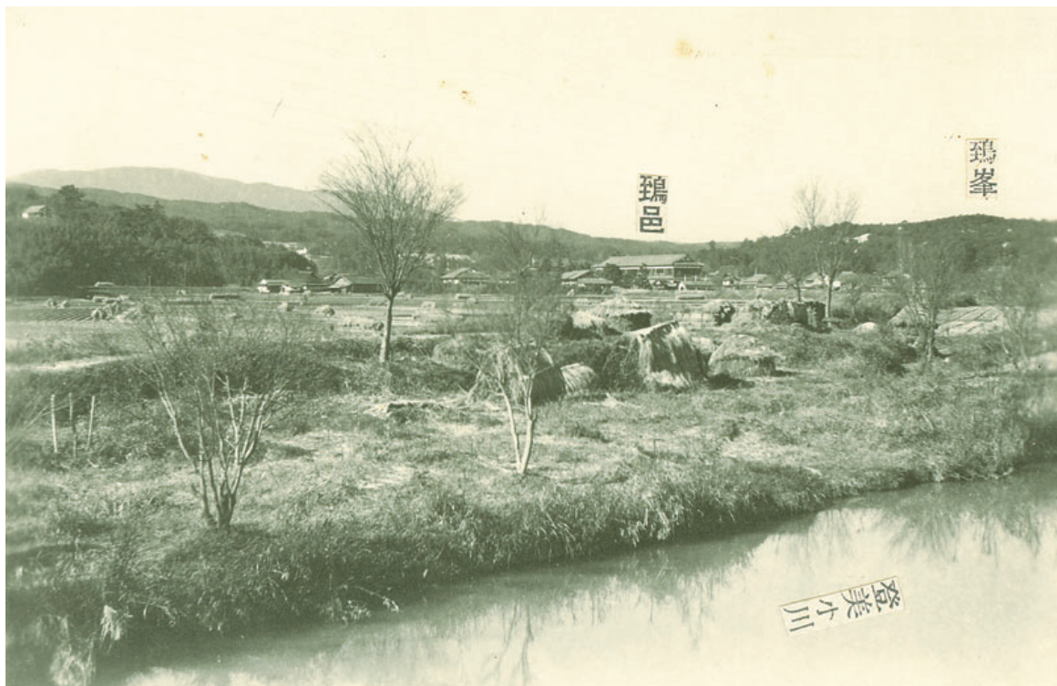
下鳥見橋より鴉邑伝承地・生駒山を望む

★発行日 平成27年10月23日 ★発行所 大倭出版局 〒631-0042 奈良市大倭町1の12 ☎(0742)44-0015 ★印刷 大倭印刷製 ★定価 1部 250円 年間購読料3,000円(送料共) ★郵便振替 01050-6-67002 大倭出版局 URL http://www.ohyamato.jp