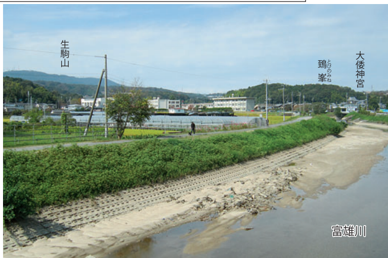
表紙写真と同じ下鳥見橋より撮影 平成27年10月6日